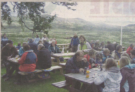
Rekordoppmøte under olsokfeiringen på Høvringen.

Folk koste seg med god mat og drikke. Det ble servert en riktig god og fyldig grillmeny med masse godt tilbehør. Eventyrbandet fra Heidal spilte og folk danset ut i de små nattetimer. Det ble bålbrekking