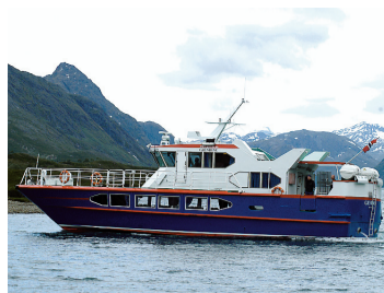
Selskapet som driv Gjende båten, ønsker seg skåle og sengjerom.

Administrasjonssjefen får delegert rett til å fatte endelig vedtak i denne saka.