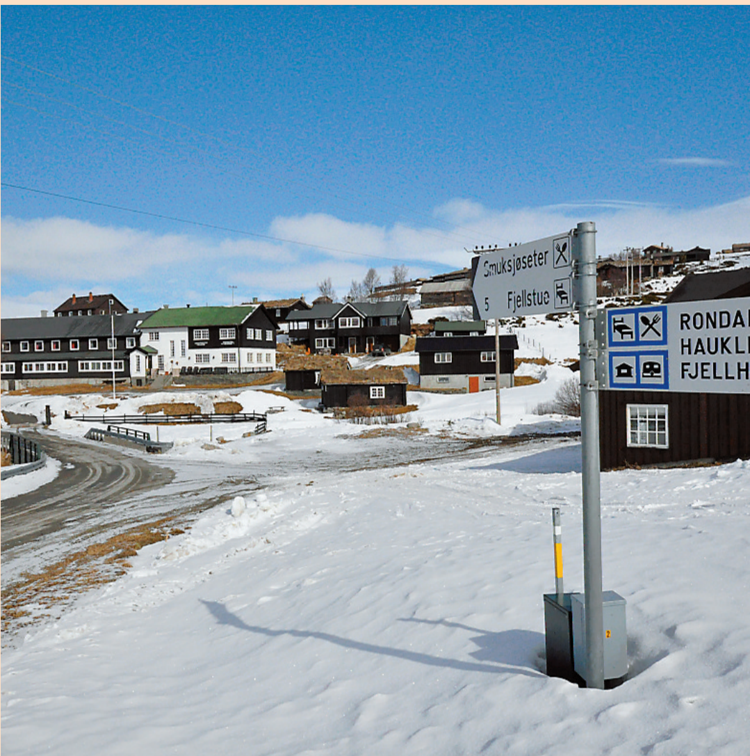
Høvringen velforening ønsker positiv utvikling i fjellgrenda.